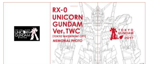
写真台紙イメージ