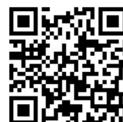
オフィシャル HP QRコード